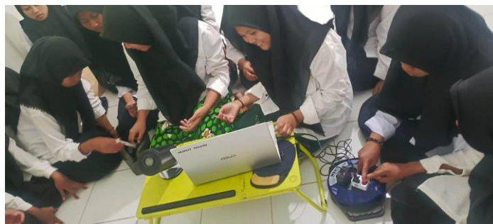
Gambar 2. Praktek deteksi hadis palsu di media Internet

disalahtafsirkan atau dipisah dari konteks, sehingga ada kecenderungan menyebarkan tanpa verifikasi. Dengan pelatihan ini, sebagian besar peserta menyatakan mereka kini “menahan jempol untuk berbagi” sebelum memastikan kebenaran konten.