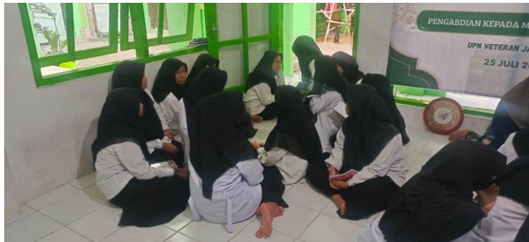
Gambar 3. Diskusi urgensi literasi hadis