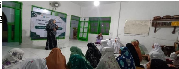
Gambar 1. Penyampaian Materi tentang konsep dasar Hadis

Lebih jauh, analisis distribusi skor per bidang materi (sanad, matan, konteks, aplikasi) menunjukkan bahwa peningkatan paling tajam terjadi pada aspek konteks dan aplikasi — yang sebelumnya relatif lemah — sehingga menunjukkan bahwa metode studi kasus dan simulasi digital efektif dalam memperkaya pemahaman aplikasi hadis dalam situasi nyata. Hal ini menunjukkan bahwa peserta tidak hanya menghafal definisi teori hadis dengan dinamika media dig