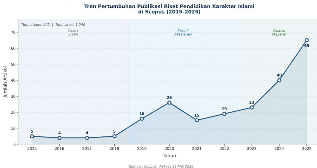
Gambar 1. Tren Pertumbuhan Publikasi Riset Pendidikan Karakter Islami di Scopus (2015–2025)

Untuk memperoleh gambaran menyeluruh tentang dinamika riset pendidikan karakter Islami, analisis pertama difokuskan pada tren pertumbuhan jumlah publikasi per tahun selama periode 2015–2025. Data yang dianalisis mencakup 222 artikel dengan total 1.240 sitasi kumulatif, sebagaimana divisualisasikan pada Gambar 1.